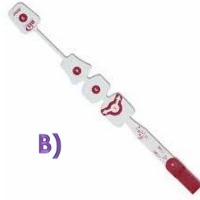
B) Sensor BIS EXTEND adulto CAJA C/25 PZS Código: 186-0160