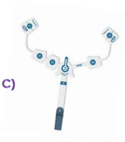
C) Sensor BIS bilateral CAJA C/10 PZS Código: 186-0212