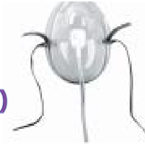
C) Mascarilla para oxigeno adulto Código: 1040