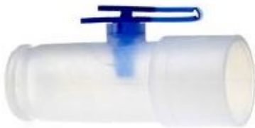
A) Adaptador MDI 22 mm OD x 22 mm ID Código: 1659