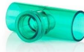
F) Conector en " T" para aerosol Código: 1077