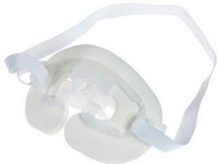
A) Sujetador endotraqueal adulto Código: 1065