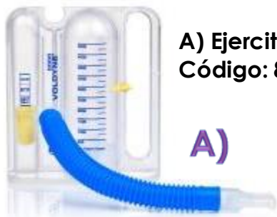
A) Ejercitador voldyne 5000 ML Código: 8884719009