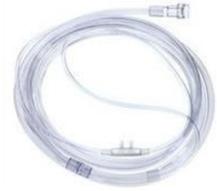
A) CANULA NASAL 7 FT CON CONECTOR STANDAR Código: 1103