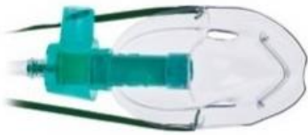
M) Mascarilla multivent adulto Código: 1088