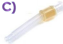
C) Adaptador para humidificador higroscópico AQUA FLEX Código: 1570