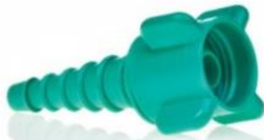
E) Cola de ratón Código: 2555