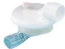
A) Humidificador filtro Código: 1575