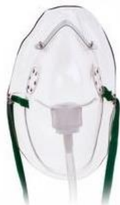
K) Mascarilla para oxigeno adulto elongada Código: 1041