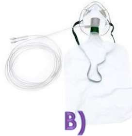
B) Mascarilla sin re-inhalacion con válvula pediátrica Código: 1058