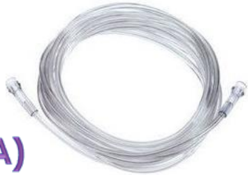
A) Tuberia de oxigeno de oxigeno 7 pies Código: 1115