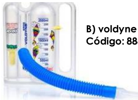
B) voldyne 2500 ML Código: 8884719017