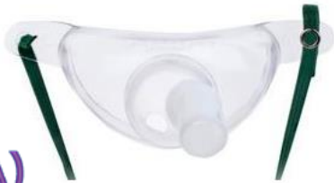
A) Mascarilla para traqueostomia adulto Código: 1075