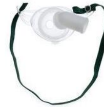
B) Mascarilla para traqueostomia pediátrica Código: 1076