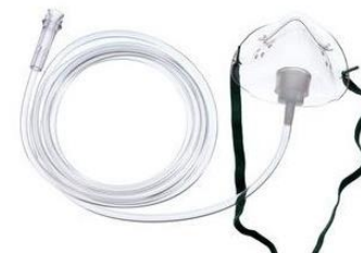
L) Mascarilla para oxigeno pediátrica elongada Código: 1042