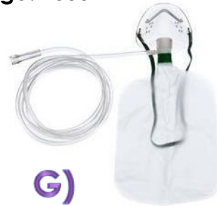
G) Mascarilla con bolsa reservorio pediátrica elongada Código: 1000