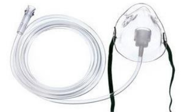
J) Mascarilla para oxigeno pediátrica Código: 1035