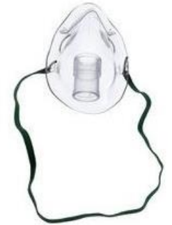
E) Mascarilla para aerosol pediátrica Código: 1085