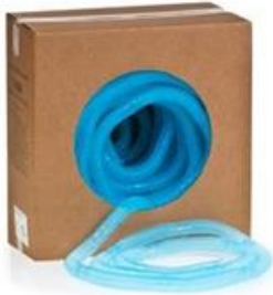
A) Tubo corrugado CORR A FLEX II EN ROLLO 100PIES Código: 1680