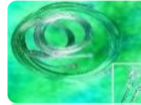
B) Tuberia de suministro de oxigeno 2.13 MTS Código: 1112