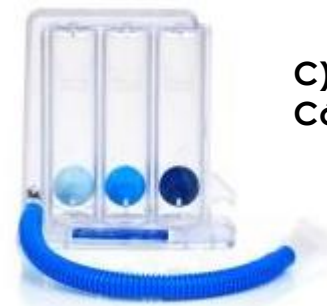
C) Espirómetro triflow Código: 8884717301