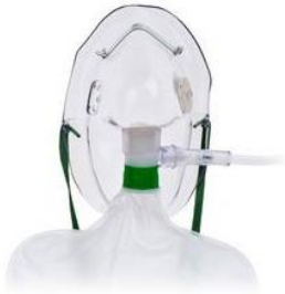
A) Mascarilla tres en uno Código: 1061