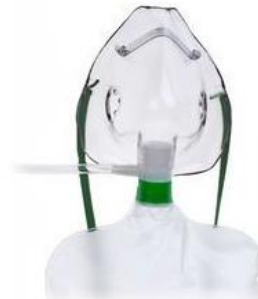
H) Mascarilla con bolsa reservorio adulto corta Código: 1009